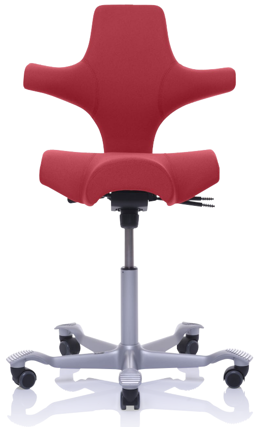
Design: Peter Opsvik. Patent- und Designgeschützt.